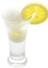
7,00 € COLONEL Citron, Vodka