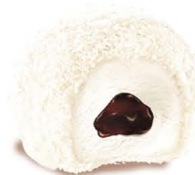
4,80 € MYSTERE COCO