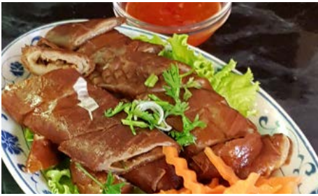
Tripes frites aux 5 parfums 5 spices deep fried tripes