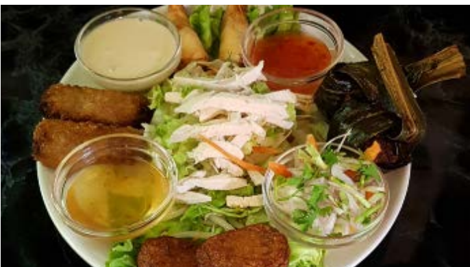
Assiette Spécialités du Chef Chef's specialities plate