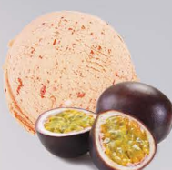
FRUIT DE LA PASSION