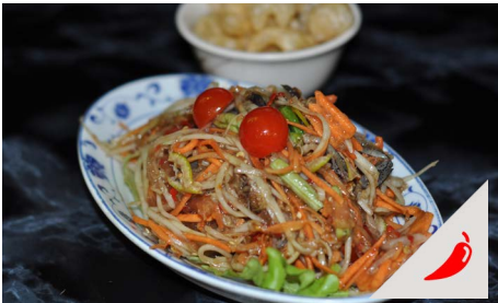
Salade de papaye façon laotienne avec Crabes salés Lao papaya salad with salted crabs