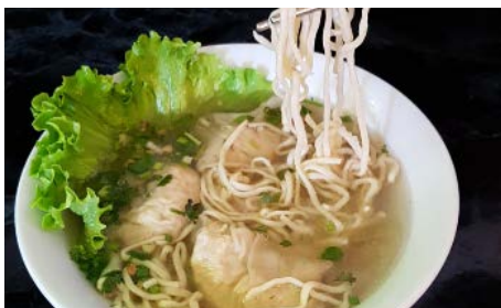
Soupe de nouilles maison aux raviolis crevettes Homemade shrimps raviolis noodles soup