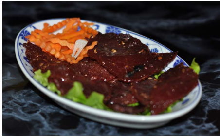
Bœuf séché aux 5 parfums 5 spices dried beef