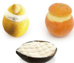
6,50 € FRUIT GIVRÉ AUX CHOIX COCO, ORANGE, CITRON