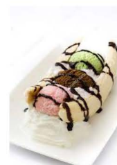
7,80 € BANANA SPLITZ CHOCOLAT, VANILLE, FRAISE