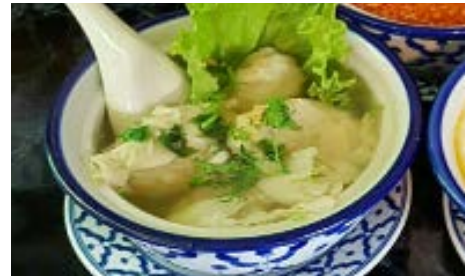
Soupe de raviolis aux crevettes Shrimps raviolis soup