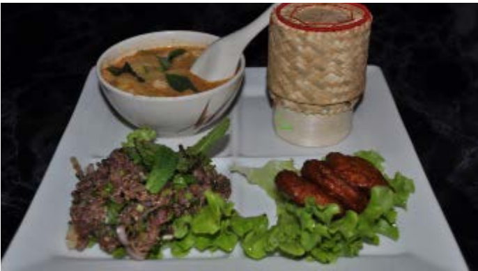
Assiette Connaisseur Expert platter