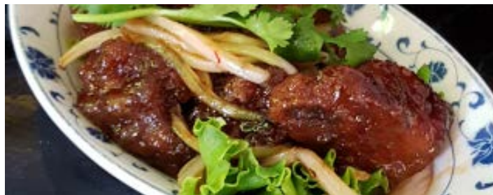
Travers de porc au caramel Caramel pork ribs