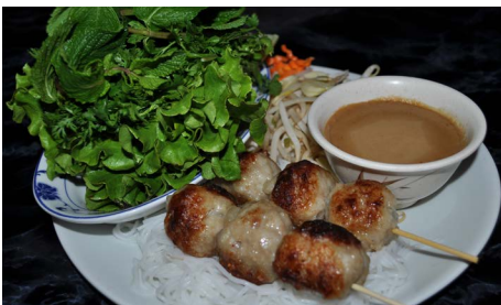
Brochettes de boulettes de porc servies avec galettes de riz et salade

Pork dumpling skewers served with rice vermicelli pancake and salad