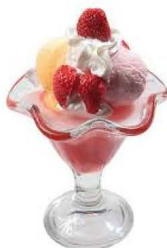
6,50 € SUNDAE FRAISE Vanille, Fraise