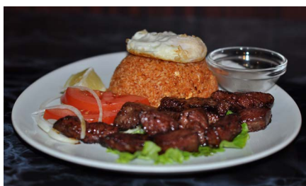
Riz au boeuf LOC-LAC