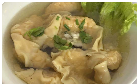
Soupe de raviolis aux crevettes Shrimps raviolis soup