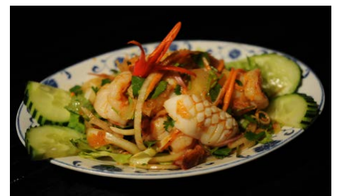
Salade de fruits de mer