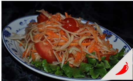
Salade de papaye façon thaïlandaise sans Crabes salés Thaï papaya salad without salted crab