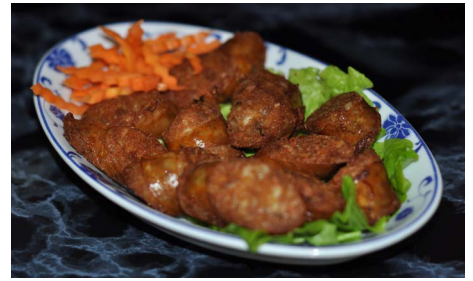
Saucisses Laotiennes Laotian sausages