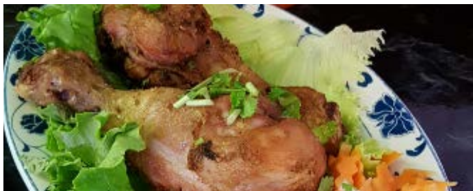
Pilon de poulet à la citronnelle Citronella chicken drumstick