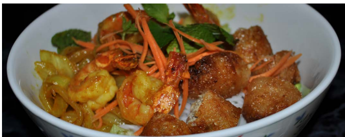
Bún Koung : Vermicelles de riz aux crevettes et nêms crevettes Rice noodles salad with shrimps and shrimps rolls