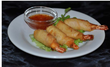
Crevettes frites à la Thaï Deep fried Thaï shrimps rolls