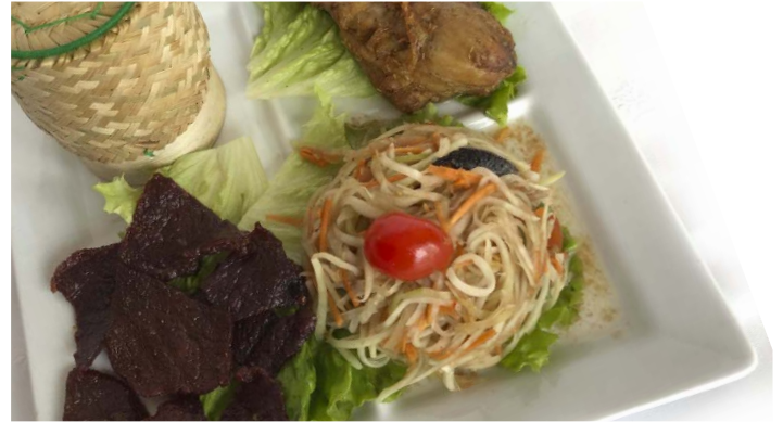
Assiette Confirmé Experienced platter