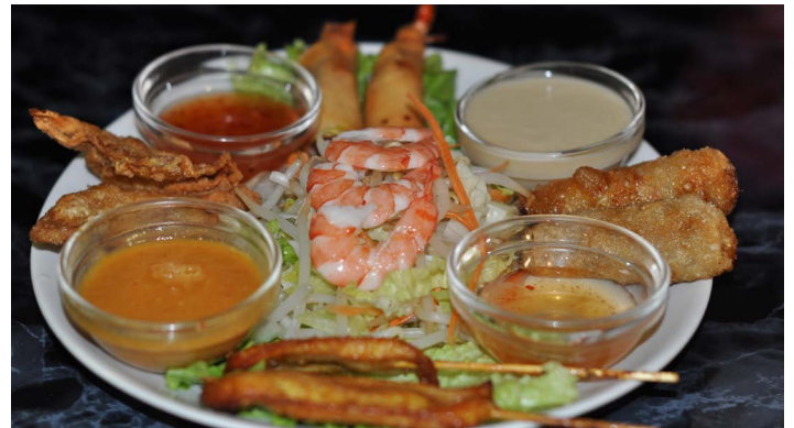
Assiettes découverte Mille éléphants Mille Elephants discovery platters