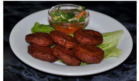
Galettes de poisson frites Deep fried fish cakes