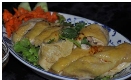
Poulet vapeur à la sauce gingembre Steamed chicken with ginger sauce