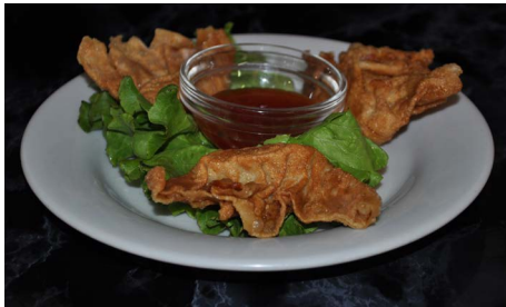
Raviolis aux crevettes frits Deep fried shrimps raviolis