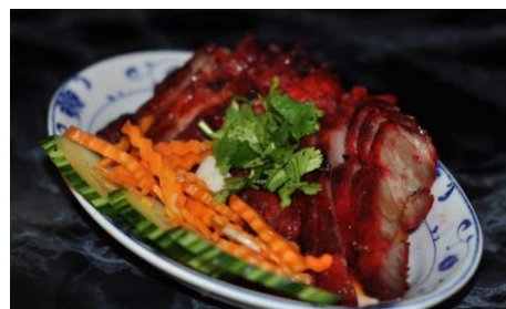
Porc laqué Lacquered pork