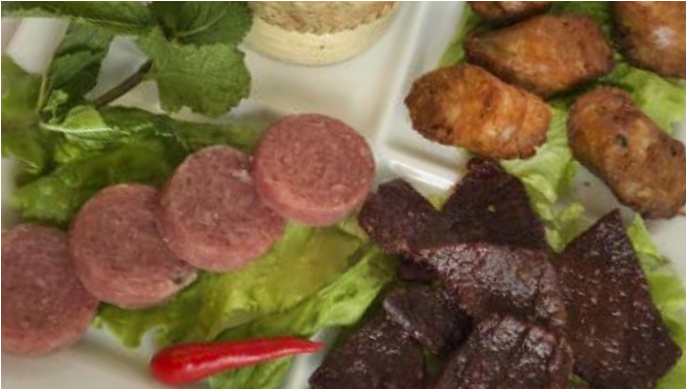
Assiette Initiation Initiation platter

( +1,20€ de supplément pour chaque modification )