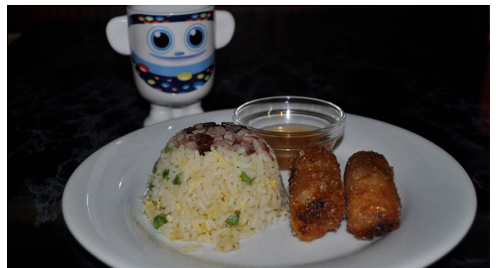
Menu enfant Children's menu