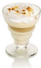
7,80 € IRISH COFEE Vanille, Café, Whisky