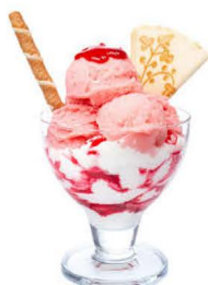
6,50 € MER ROUGE SORBET FRANBOISE ET FRAISE