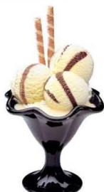
6,50 € DAME BLANCHE Vanille