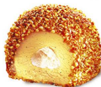
4,80 € MYSTERE VANILLE