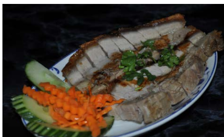
Rôti de poitrine de porc Roasted pork forehead