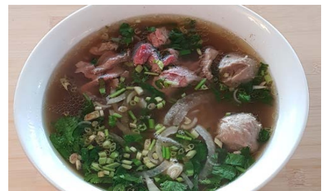
PHÔ : Soupe tonkinoise aux viandes variées Tonkinese soup with mixed meats