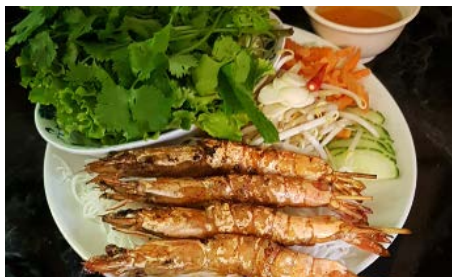
Brochettes de gambas servies avec galettes de riz et salade

Prawn skewers served with rice vermicelli pancake and salad